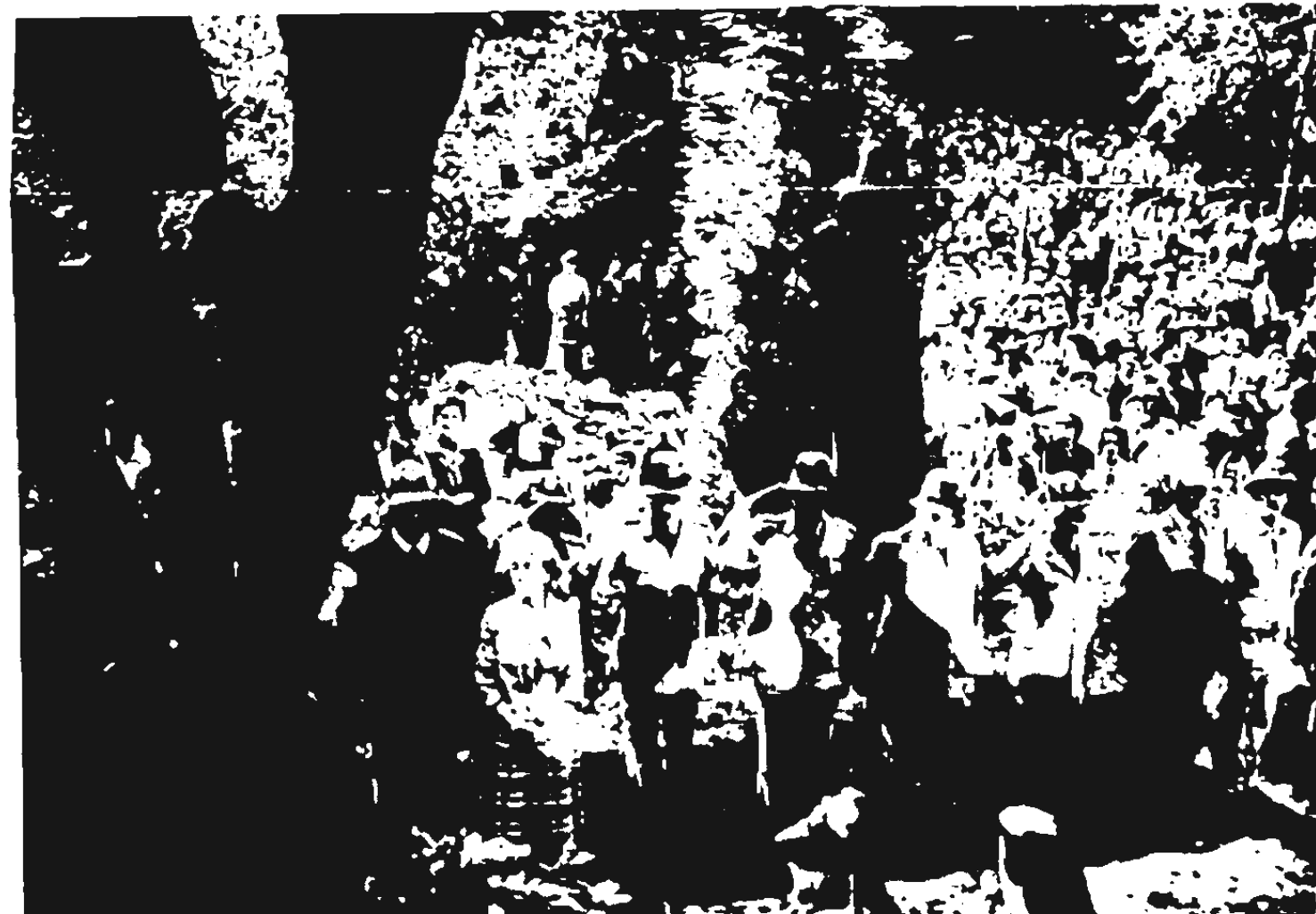
Un momento dello iniziale omaggio ai Caduti.

ve, Falzé di Trevignano, Follina, Fontigo, Fregona, Gaiarine, Gorgo al Monticano, Guida di Valdobbiadene, Mareno di Piave, Maserada sul Piave, Miane, Mugliano Veneto, Montaner, Montebelluna, Mosnigo, Motta di Livenza, Musano di Trevignano, Negrizia, Nervesa della Battaglia, Oderzo, Ogliano, Ormelle, Orsago, Paese, Parè di Conegliano, Pero di Breda di Piave, Piavon di